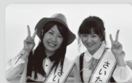
11代目・レピスマイリー 2017年度 さいたま観光大使