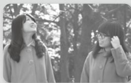
9代目・Core 2015年度 さいたま観光大使