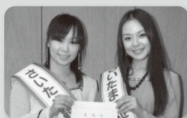
5代目・Delight Style 2011年度 さいたま観光大使