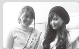
10代目・DREAM GIRLS 2016年度 さいたま観光大使