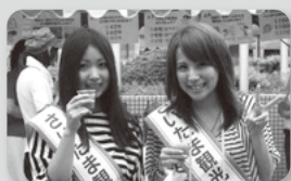
4代目・noconoco 2010年度 さいたま観光大使